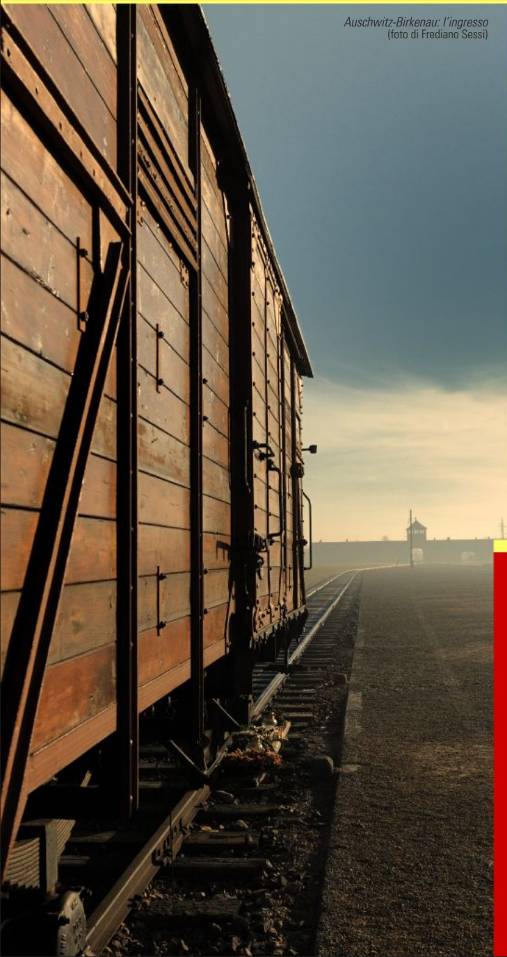
Auschwitz-Birkenau: l'ingresso